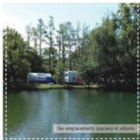
Des emplacements spacieux et arborés