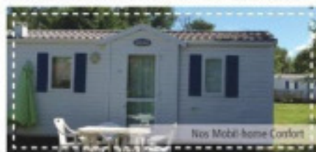
Nos Mobil-home Confort

Le charme du camping le confort en plus. Le camping vous propose des locations de mobil-homes 2 et 3 Chambres, coco sweet 2 chambres, chalet 1 chambre+ 1 canapé convertible.