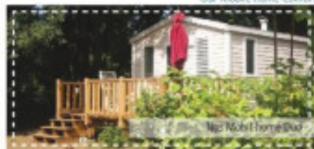
Nos Mobil-home Duo